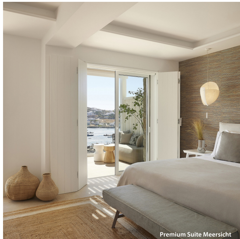
Premium Suite Meersicht

Gegen Gebühr: Massagen: Klassische Massage; Wellness- & Beautyanwendungen; Kosmetische Gesichtsbearbeitungen. Fahrrad und E-Bike Verleih.